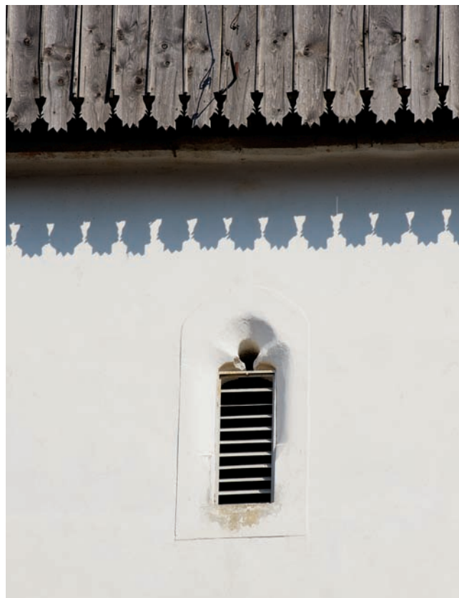
8. Вікно з півкруглим завершенням верхнього ярусу західної сторони дзвіниці

До повної картини середньовічної церкви – до періоду реформації – належали і її внутрішні фігуральні розписи. Вперше про фрески в Бене написав у 1865 році Імре Генсльманн. 21 Він побував тут разом з Флорішом Ромером і Ференцем Шульцом 23 вересня 1864 року, 22 саме тоді зробив