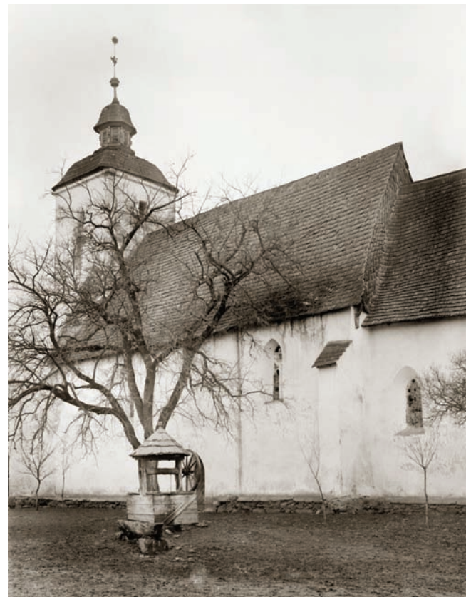
6. Церква з південно-східної сторони (1906 р.)

Однак можна сформулювати певні сумніви стосовно зведення дзвіниці на західному фасаді одночасно з усією будівлею, передусім через своєрідність трьох вікон з прорізами форми півкіла, а також певну відмінність цоколю дзвіниці,