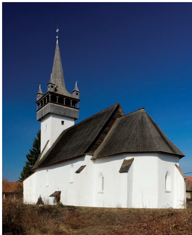
10. Церква з південно-східної сторони після відновлення

В рамках ремонту замінили також на нову і покрівлю церкви та дзвіниці. У випадку церкви відбулася реконструкція даху середньовічного характеру, який ще стояв на місці і був задокументований у 1906 році. Це було необхідно, тому що у 1940 році дах згорів, і тоді його тимчасово замінили на досить плоску бляшану покрівлю. Цей дах на наші дні вже надзвичайно застарів, як в інженерному, так і в моральному плані. Заміна бляшаного шпилью дзвіниці з XIX століття також була обумовлена жалісним технічним станом. Керуючий реставрацією архітектор 30 прийняв рішення про відтворення колишньої архітектурної форми, підтвердженої і доступними на місці даними, тобто зведення шпилья з чотирма фіалами, галереєю і