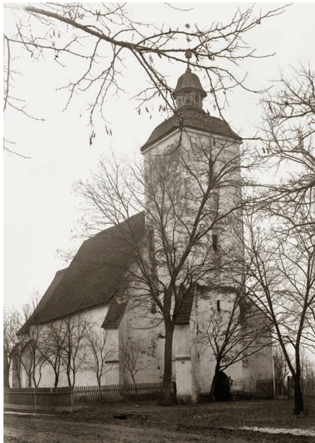
1. Церква з північно-західної сторони (1906 р.)

У період середньовіччя частина села, в якій мешкали кріпаки, належала до володіння замку сусіднього Квасова (Kovászó), а меншу частину складали дворянські маєтки. Відомі і визначальні сім'ї, які мали тут володіння до кінця XV століття