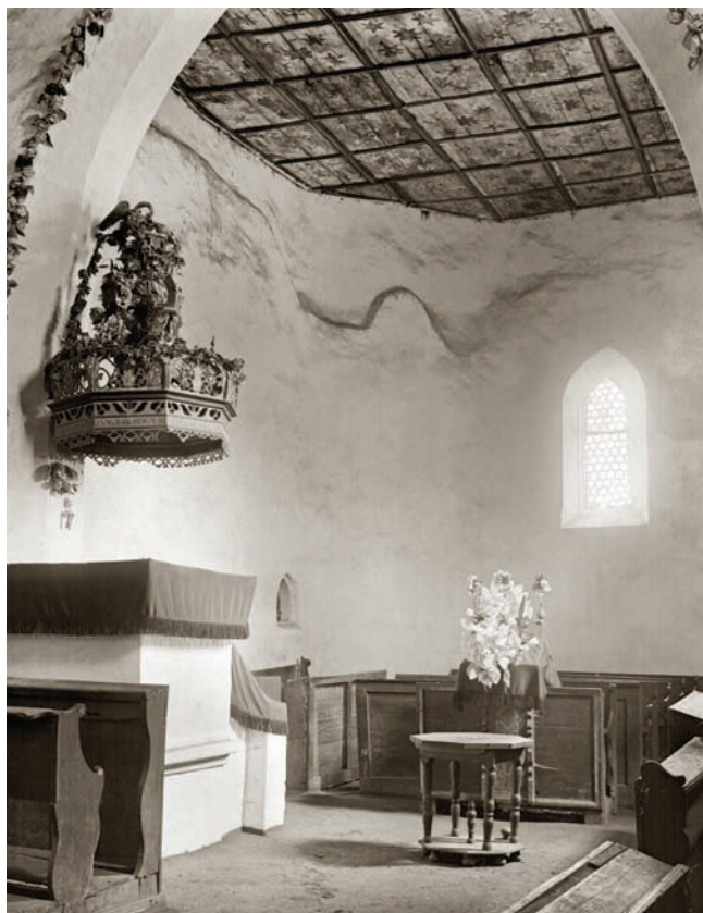
9. Апсида церкви (1906 р.)

Наступною згадкою про розпис є звіт Тиводара Легоцького на головному листі архітектурної пам'ятки, складеному про будівлю 20 жовтня 1876 року: на північній стіні церкви під шаром вапна знаходяться фрески; з північного боку тріумфальної арки зійшла штукатурка, з-під якої видно фігури, а саме зображення Діви Марії, яка тримає в руках померлого Христа. Кольори на ній яскраві. Безперечно, що колись вся церква була розписана. Так само і ззовні добре помітні пофарбовані червоним проміжки каменів і чорним – лінії карнизу . 24 Легоцький повернувся до справи фресок і у своїй монографії про Березький комітат. Згідно з цим: на північній стіні стріластої тріумфальної арки бачимо зображення Мадонни, яка тримає в руках мертвого Христа. Шкода, що нещадність замазала брудом цю фреску, яка з'явилася з-під шару вапна; колись церква була