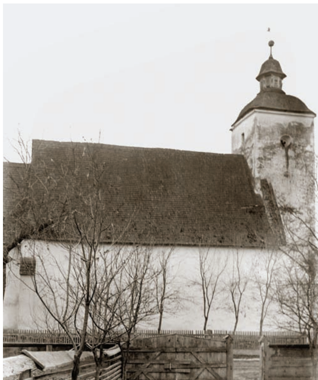
2. Неф та дзвіниця церкви з північної сторони (1906 р.)

Письмові джерела про час будівництва церкви нам невідомі, однак на основі перших даних з 1333 року, в яких вже припускається її існування, цілком ймовірно, що вже і перед теперішньою будівлею тут могла стояти якась менша церква. Час її зведення, точне місце, розміри і форму – за відсутності археологічних розкопок – визначити неможливо. Щодо нижче спробованого датування сьогоденної будівлі ми також можемо спиратися лише на нині вже зруйновані або покриті побілкою деталі, зафіксовані в описах, на малюнках і фотознімках топографічними дослідниками, 12 які обстежували її в період між 1864-1906 роками, а також на паралелі з такими формами, які ми в змозі побачити або впізнати. На жаль, виявлення закритих елементів, а також детальне дослідження стін не відбулося під час останньої реставрації будівлі, яка пройшла між 2001-2004 роками, тому ми не в змозі надати остаточно підтверджений опис історії будівництва церкви.