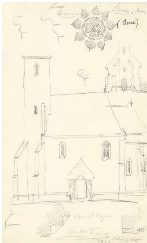
3. Схематичний план, виготовлений Ференцем Шульцом у 1864 році

До зверненої престолом до сходу апсиди церкви з внутрішньою шириною 6 м, яка закінчується трьома гранями восьмигранника, примикає прямокутна нава з внутрішніми розмірами 8,05 × 16,30 м, а також триярусна фронтонна дзвіниця, зміцнена контрфорсами. Товщина стін нави, апсиди і триумфальної арки всюди становить приблизно 100 см, а у випадку дзвіниці на першому поверсі досягає біля 120 см. Найтовстішою конструкцією будівлі є західна стіна нави; її товщина становить майже 150 см, на ній полягає і східна стіна корпусу дзвіниці. До північної стіни апсиди колись приєднувалася і ризниця, яку після зміни релігії знесли. Залишки її фундаменту видно й по нині.