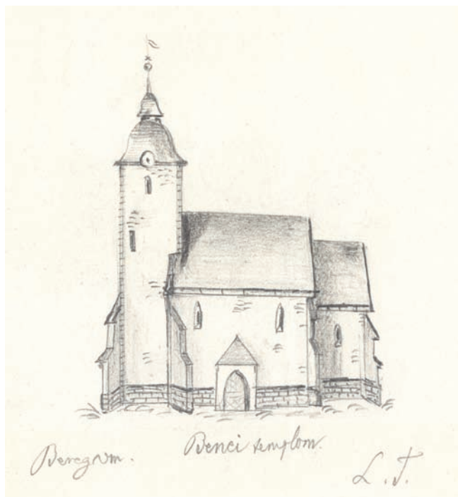
7. Креслення Тиводара Легоцького (1874 р.)

його оформлення з меншим виступом, і нарешті через різниці в структурі і текстурі стін. Про те, що дзвіницю могли побудувати трохи пізніше, ніж решту церкви, може свідчити і надзвичайно стрімко оформлений, високий західний фронтон з першого періоду. 17 На підставі всього вищезгаданого можна припустити, що дзвіницю добудували до церкви лише через кілька років або десятиліть після її зведення. У такому уявленому випадку і кругле вікно з чотирма півколами легко знайшло б своє місце в якості «розетти» в центрі колишнього західного фронтону. Теоретично і два стрілчастих вікна дзвіниці з півколами можуть бути розміщені в інших місцях церкви. 18