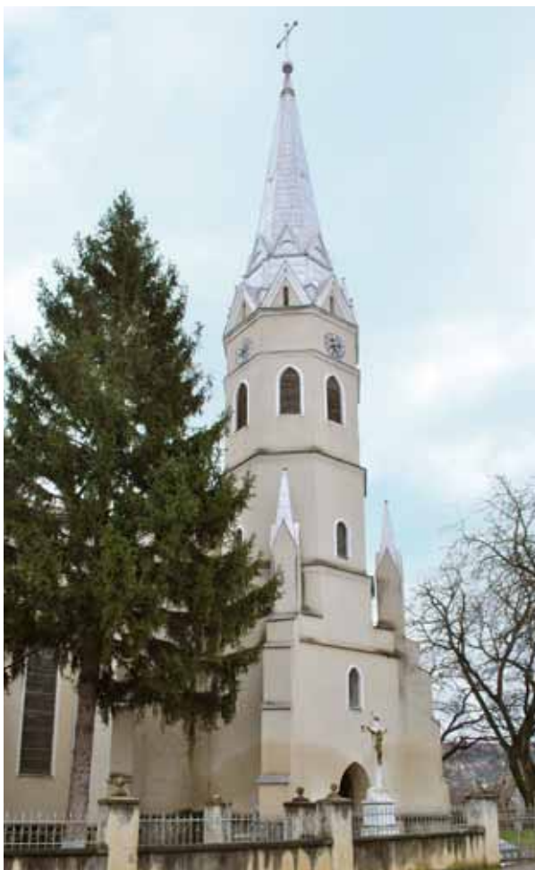
6. A templom tornya északnyugatról

Mindenesetre arra azért utal, hogy 1500 környékén valamilyen komolyabb építőtevékenység folyhatott a templom, és persze azt sem lehet kizárni, hogy a rajzról ismert és részben fennmaradt épület – leszámítva a tornyot – ekkor keletkezett egy korábbi helyén. Miután úgy tűnik, hogy a települést ebben az időben már teljes egészében a Drágfi család birtokolta, az építető vagy Drágfi Bertalan (1447–1501) erdélyi vajda volt, vagy az ország-bírói tisztséget is betöltő fia, János (†1526), aki végrendeletében két jelentősebb tételt is hagyott a bélteki egyházra. 39 Az egykori templom nagysága és a fennmaradt mérmű minősége egyébként szintén az arisztokráciához tartozó megrendelőre utal. A középkori épület jó részének eltűnte azért is érzékeny veszteség, mert a templom meghatározó emlék lehetett a környék egykorú egyházi építkezései számára.