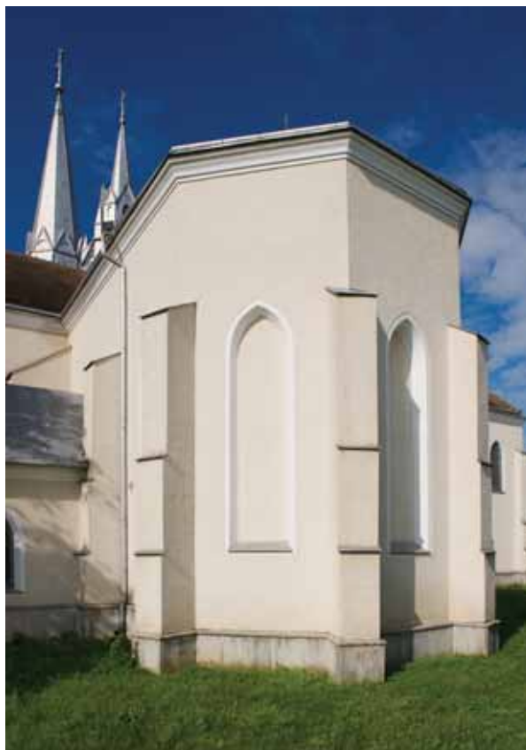
2. A szentély délkeletről

A templom hajójából az átépítés miatt csak nyugati végének egy rövid szakasza maradt meg. 15 A hajó többi részéről a szóban forgó ábrázolás szolgál információkkal. A rajz téglalap alaprajzú teret mutat, amely majd két-két falvastagsággal szélesebb, mint a szentély. 16 A hajót kívül