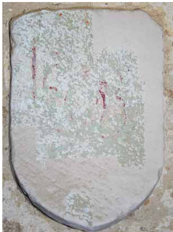
4. Címerpajzs a hajó nyugati bejárata fölött

visszaugratásként jelentkezik, középen vékonyabb, majd feljebb vastagabb párkány fogja körbe a tornyot. A formája alapján bizonyosan újkori sisak alatt koronázópárkány is megjelenik. A három párkány pálcátagos profilja eltér egymástól, de pontos alakjukat nem lehet kivenni a rajzon. 27 A tornyon három szinten jelennek meg ablakok. Legalul a négyzetes részen, majd a nyolcszögű szakasz vékonyabb párkánya alatti és feletti szinten. Míg az előbbi két esetben egy-egy ablakot látni, a két párkány által közrefogott, s már ezzel is kiemelt felsőbb szinten mindhárom megjelenő toronyoldalon áttöri a falat ablaknyílás. A mai kialakítás nagy valószínűséggel azt is megmutatja, hogy a tornynak a rajzon nem látható oldalain hol voltak az ablakai. A négyzetes rész mindhárom szabadon álló oldalát áttöri ablaknyílás, ezek felett középen szintén vannak ablakok, de itt az átlós falakon még nem, a legfelső, ablakos emeletnek pedig már minden oldala nyílással tagolt. A rajzon az összes ablak nagyjából azonos méretű és kialakítású. Formájuk miatt biztos, hogy középkori részletekről van szó: rézsús könyöklőpárkányukról profilozott bélletek indulnak felfelé, s felül csúcsívesen záródnak. 28 A torony két nyugati sarkát egy-egy átlós elhelyezkedésű támpillér támasztja. A pillérek háromszögűek, és arányuk hasonló a hajón látható pillérekéhez. Felső harmaduk