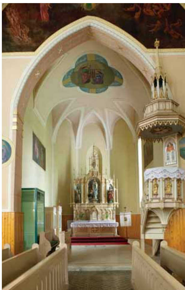
3. A szentély belseje kelet felé

ban. A hajó északi oldalát nem bontották meg ablakok. 22 Annak okáról, hogy a déli fal nyugati szakaszában miért nem jelenik meg ablak – itt egyébként ma sem látható nyílás –, az alaprajz ad felvilágosítást. A hajó belsejében, e szakasz keleti támpillér vonalától kissé keletre, két négyzetes pillér látható, melyek nyilvánvalóan nyugati karzatot hordtak. 23 A hajóból ma rézsús bélletű, csúcsíves ajtón lehet belépni a toronyba, amely valamelyest őrizheti még a középkori formát. 24 Az egykori hajó nyugati falának belső oldalán, a karzat szintjén nagyméretű, rézsús bélletű és csúcsíves záradékú, elfalazott ablaknyílás jelenik meg középen. Hogy ennek a fal azon szakaszán, amelyhez kívülről a torony csatlakozik, mi volt a funkciója, nem világos. 25