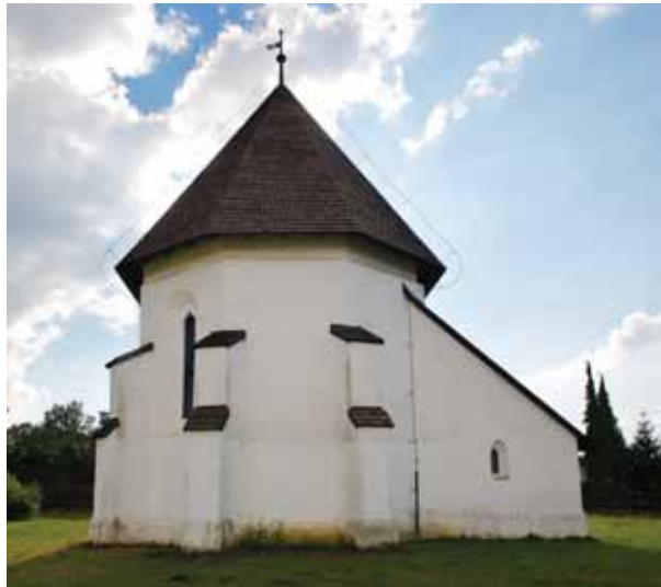
3. Biserica dinspre est

Detaliile arhitecturale găsite în timpul cercetărilor ne arată că spațiul răsăritean al bisericii și-a căpătat forma actuală prin transformarea unui sanctuar mai vechi. La 1,5 metri est de stâlpii arcului de triumf menționat mai sus au fost descoperite fundațiile altor doi stâlpi aparținând unui arc de triumf mai vechi, iar pe latura sudică au apărut bazele unui contrafort; de asemenea, între cele două ferestre al zidului sudic al sanctuarului a fost găsită partea superioară a unei ferestre cu arcul frânt și se vorbește despre urmele unei bolți mai vechi, semicilindrice, care ar fi avut penetrații(?). Aceste date ne arată că primul sanctuar a fost mai scurt decât cel păstrat astăzi și a fost boltit. Zidurile lui laterale au fost menținute, însă arcul de triumf a fost schimbat cu unul nou, susținut din exterior cu două contraforturi noi. A fost puțin lărgit și spre vest, iar în loc de o fereastră s-au realizat două, între care s-a așezat și un contrafort. Ultimul a devenit necesar