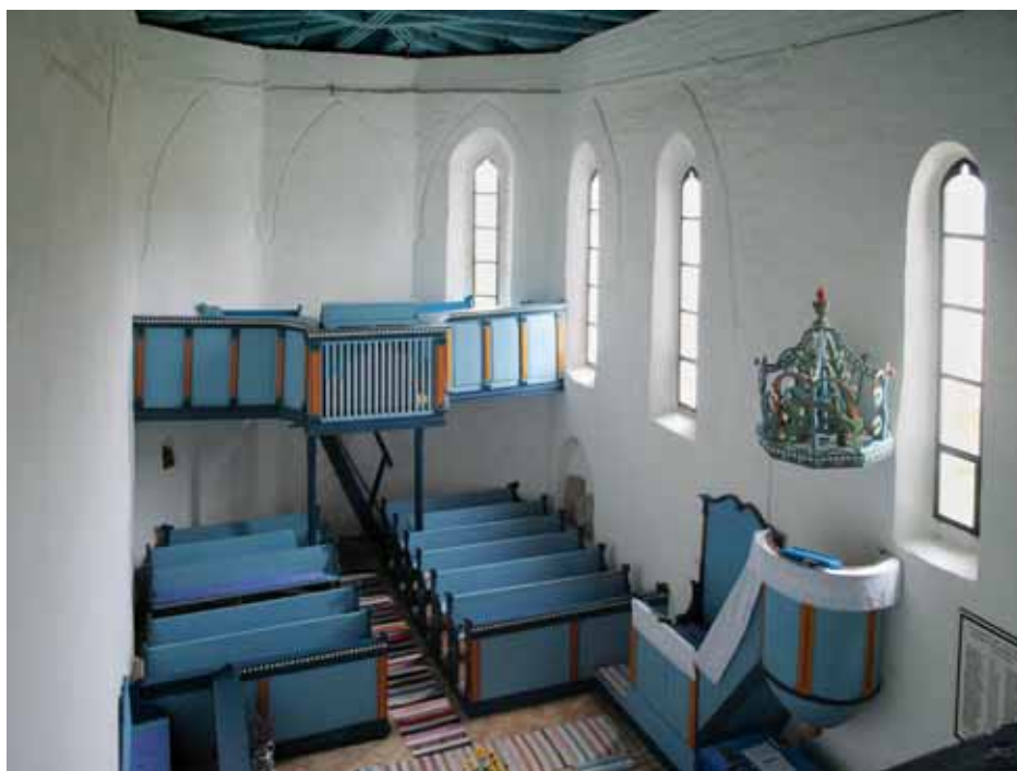
4. A templom belseje nyugat felől

A templom két középkori periódusának pontosabb keletzése a kevés és nagyon egyszerű részletforma alapján alig lehetséges. 14 A szentély poligonális záródása miatt az első periódus nem származhat sokkal korábbról, mint