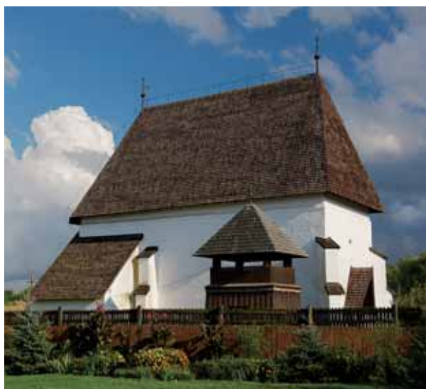
1. A templom északnyugat felől

A kisméretű, keletelt épület jórészt jelenleg is középkori formájában áll. 3 Téglalap alaprajzú hajójához keletről azonos szélességű, a nyolcszög öt oldalával záródó, kétszakaszos szentély csatlakozik. A szentély északi oldalán az 1990-es évek első felében visszaépített, négyszög alaprajzú sekrestyéépület emelkedik, melynek kiterjedését, dongaboltozatának egykori létét és szentélybe vezető ajtónyílását ásatással és falutatással tisztázták. 4 A templomot kívülről kétosztagú támpillérek támasztják: a sarkokon átlós elhelyezkedésűek, a szentély és a hajó határára – mind az északi, mind a déli oldalon –, illetve a szentély déli falának közepén pedig a falakra merőlegesek. 5 A támpillérek részletformák nem jelennek meg, felső részük