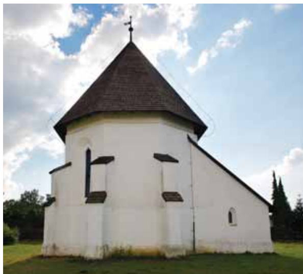
3. A templom kelet felől

A templom épületkutatása során előkerült további részletek arra utalnak, hogy a ma látható szentély egy korábbi szentély átalakításával keletkezett. A fent leírt diadalívpillérektől másfél méterre keletre feltárták egy korábbi diadalív mindkét pillérének az alapozását, a déli körítőfal külső oldalán egy vele nagyjából egy vonalba eső támpillér alapjával együtt. 12 A szentély két déli ablaka közt pedig előkerült egy korábbi ablaknak az elfalazott csúcsíves záradéka. Állítólag egy régebbi, a záradék három oldalán fiókokkal (?) kialakított dongaboltozat maradványa is napvilágot látott volna a szentélyben. Mindezek azt mutatják, hogy a korábbi, szintén boltozott és a sekrestyével együtt épített szentély rövidebb volt a maiénál, és déli, illetve délkeleti falszakaszán egy-egy ablakkal volt csak tagolva. E régebbi szentélyt körítőfalának megtartásával, de diadalíve elbontásával és új építésével – amelyet kívülről támpillérekkel is megtámasztottak – nyugat felé némileg megnyújtották, s déli oldalán egy helyett két ablakot alakítottak ki, köztük új támpillérral.