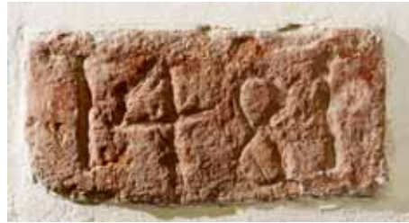
1. Cărămidă datată pe interiorul peretelui nordic al sanctuarului

Prima semnalare documentară a acestei așezări de pe malul Someșului, care până în ultimul sfert al veacului a XIV-lea s-a aflat în domeniul regal, este legată de parohia catolică și de preoți de-ai săi listați în registrele dijmelor papale din anii 1332-1334. Așadar, se poate admite că parohia Szamosbecs a arhidiaconatului Ugocsa din episcopia Transilvaniei avea atunci, pentru nevoi liturgice, o construcție proprie. În afară de registrele invocate, nu mai sunt cunoscute alte izvoare de cancelarie care să ateste, direct sau indirect, parohia catolică și/sau biserica sa 1 . Însă, în cursul renovărilor de la începutul anilor 1980, a intrat în discuția despre istoria bisericii o inscripție cu anul 1481 care a fost incizată pe suprafața unei cărămizi (de proveniență necunoscută) 2 . Înafara ei, mai există și informații despre o epigrafă din navă, cu anul 1683, potrivit