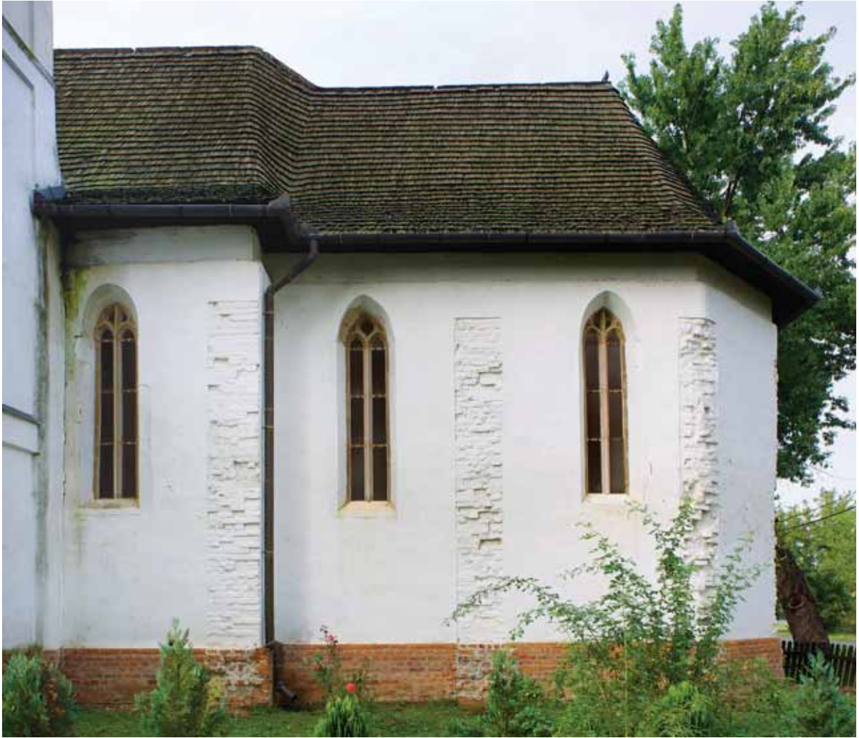
5. Imaginea sudică a laturii estice a bisericii

este rezultatul unei intervenții din Epoca Modernă, iar forma medievală îi rămâne necunoscută. Pe latura vestică a peretelui nordic al absidei se poate vedea ancadramentul în arc frânt, de piatră, al fostei intrări înzidite a sacristiei, cu profilatura având muchiiile teșite. Sub fereastra estică a peretelui sudic se mai poate observa o nișă cu terminația în unghi. Urmele din piatră cioplită ale bolții de odinioară a absidei au fost descoperite pe zidurile perimetrice. Pe baza lor putem presupune că nervurile au avut profilatura alcătuită din două cavete succesive 15 . În sanctuar, în urma săpăturilor a fost dezvăluit fundamentul de cărămidă al altarului medieval 16 .