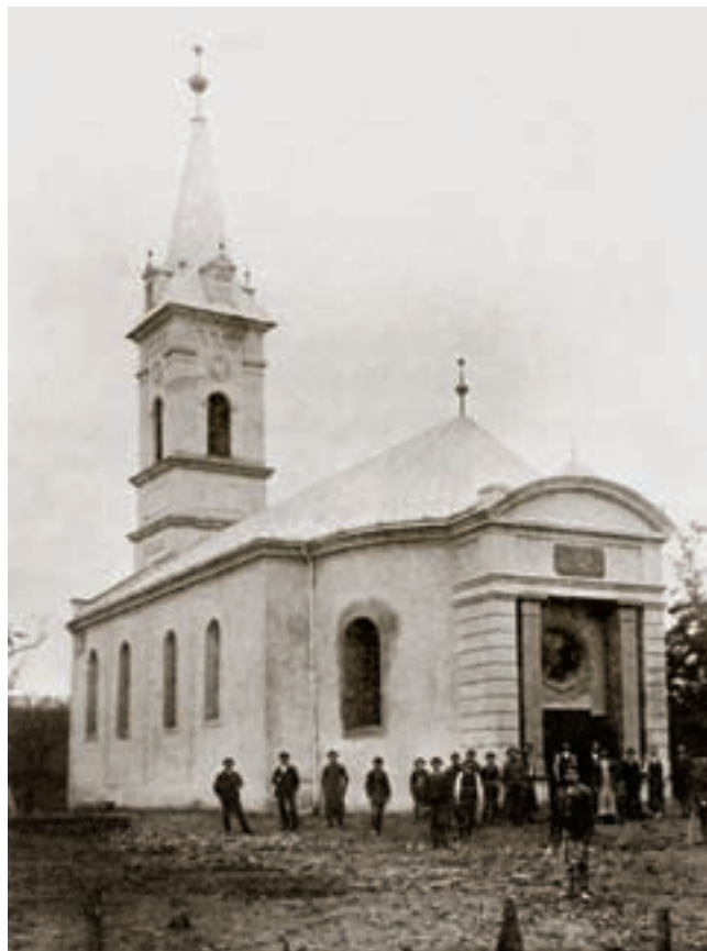
3. A templom 1900 körül

hajófal között a vakolat leverése után egy egysornyi téglával berakott, téglalap alakú részt (befalazott tükröt) találtunk. Amikor ezt elbontottuk, derült ki, hogy a befalazással a diadalívből kiinduló, keskeny falpillért kívánták 1847-ben eltüntetni. Az igaz, hogy a téglaberakással a falpillér „láthatatlanná” vált, ám a belőle kiinduló hevedert mégsem sikerült síkba hozni: a rá kent vakolat eltávolításával látni lehetett a heveder indítását. Ugyanezt a téglalap alakú tükröt megtaláljuk a diadalív hajó felőli oldala és az északi hajófal között is, azzal a különbséggel, hogy itt két nagy, egymásra rakott kő jelezte a heveder indítását. A nyugati hajófalban ez a jelenség (mármost a pillérek hevederívének a beakötése) nem volt kutatható, ugyanis az eredeti falszövet 1944-ben elpusztult. Mindenesetre ez is elég támpont volt ahhoz, hogy kimondjuk: a szabolcsi „monostor” háromhajós templom volt, a szögletes, kőből épített 3–3 pillért mindkét oldalon hevederívek kötötték össze egymással és kötötték be a pilléreket a hajó nyugati, illetve a diadalív felőli keleti falába. A 1×1 m-es kőpillérek és a hevederívek könnyen megtarthattak egy a hajófal magasságánál kisebb méretű, a főhajóból kiemelkedő, ablakokkal ellátott falszakaszt, különösen akkor, ha Jósa András leírásának hitelt adunk: Oszlopok nyúltak fel még egyszer annyira, mint most a templom fedele. Azaz Jósa írása és a kutatás egybehangzó