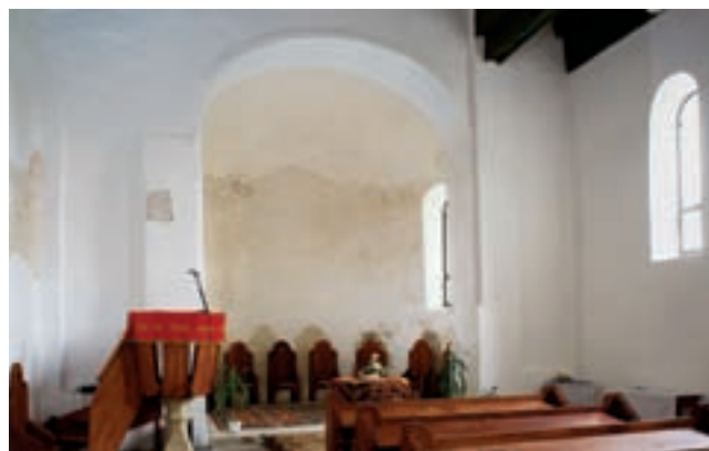
5. A templombelső kelet felé

A XV. század elején lesz a Szűz Mária-egyház plébánia, ehhez viszont szükséges volt egy (5,4 × 3,4 m belső méretű, sarkain támpillérrel megerősített) sekrestyét építeni. Ez még 1475 előtt történt (az 1487-ben fiágon kihalt Upori család utolsó tagja, László 1475-ben adta zálogba birtokait). Ugyancsak ezzel az építkezéssel függ össze a diadalív jelenlegi, szegmensíves felső záródása. Ennél korábbi időre, a Zsigmond-korra tehető a szentély kifestése, ahol az 1900-as építkezésre visszaemlékezők szerint a 12 apostolt (vagy szenteket?) ábrázolták. Saj-