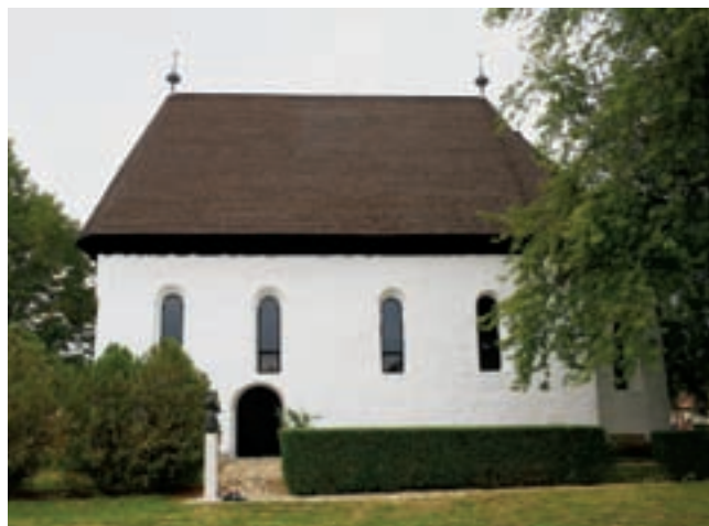
1. A templom déli nézete

Jósa András leírását idézve: Ez a templom csak megmaradt része egy hajdani nagyobbaknak, mert több helybeli egyén állítása szerint, a templomnak még negyven év előtt is két sor ablaka volt, úgy, hogy emeletesnek látszott. Oszlopok nyúltak fel még egyszer annyira, mint most a templom fede-