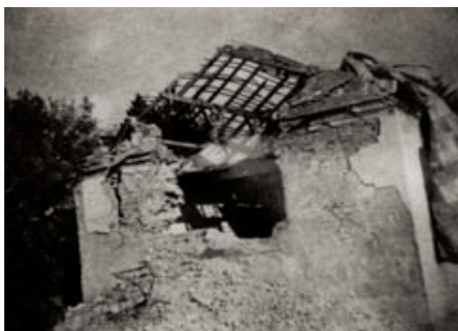
4. A templom nyugati homlokzata 1945-ben

eredménye szerint Szabolcsban két mellékhajós, közepén kiemelkedő főhajós, tehát magas, bazilikás felépítésű templomot emeltek. Sajnos a templom oldalhajóinak eredeti párkánymagasságát megállapítani nem tudtuk, mert azt 1847-ben visszabontották. Így természetesen az alig 1 m széles oldalhajók boltozatára sem volt bizonyító részlet, csak a tokaji kőművessel kötött, 1757. évi szerződés, amelyben egyértelműen boltozatról írtak (amelyet majd vakolni, festeni kell). Közvetve viszont a boltozat meglétére utal az a tény, hogy az északi mellékhajó megvilágítására a hajó falába két tölcsérbélletes, kis ablakot építettek a diadalív és a bal 1. pillér, illetve a bal 3. pillér és a nyugati zárófal között. A kiugró főhajó minden bizonnyal nyitott fedélszékű volt.