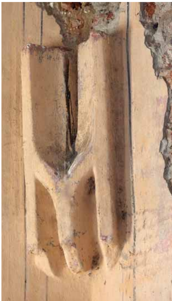
6. Desprinderea bolții din colțul sud-estic al corului

Nagyéc, rezultată din preluarea eronată a formei, nu poate fi datată, credem, înainte de cumpăna secolelor XV-XVI. 13 În principiu, nu e exclusă nici construcția corului în anii 1490, dar detaliile renascentiste (profilatura ușii sacristiei și tabernacolul) indică mai degrabă datarea acestuia în primele două-trei decenii ale secolului al XVI-lea. 14