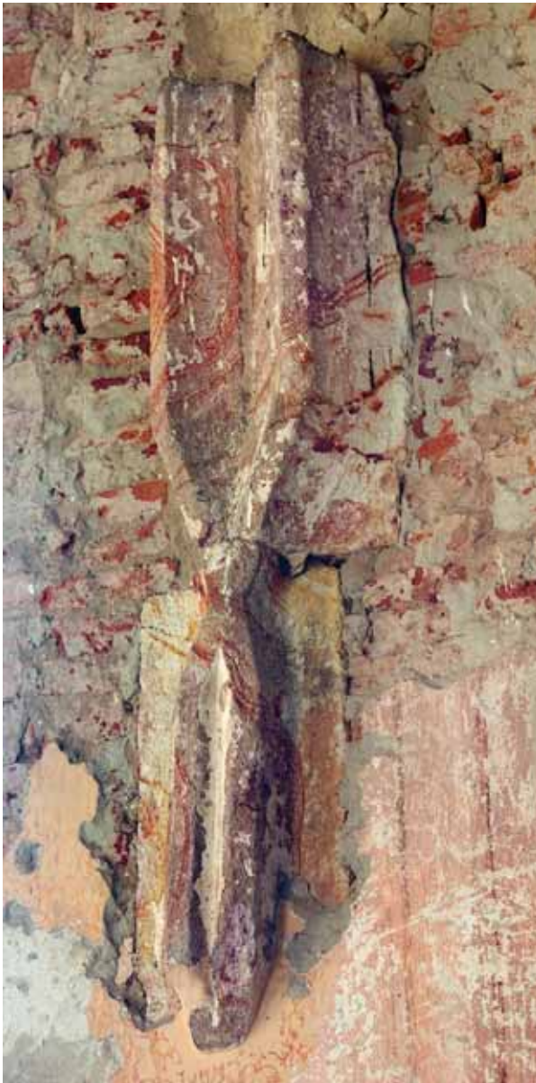
5. Desprinderea bolții de pe peretele sudic al corului

partea superioară a deschiderilor bipartite s-au păstrat muluri, lipsind însă menourile. Fereastra mijlocie, identică cu aceea din stânga, prezintă deasupra golurilor încheiate semicircular două muluri în formă de migdală. În cazul ferestrei din dreapta apar în schimb două muluri flamboaiante. Profilatura mulurilor nu conține listeluri proeminente. Ancadramentele din piatră nu cuprind întreaga grosime a ambrazurilor, acestea fiind completate dinspre exterior și interior cu cărămizi. Cezurile perceptibile pe muchiile ambrazurilor, precum și arcele de descărcare din cărămidă de deasupra deschiderilor se datorează probabil acestui fapt. 9 Detaliile semnalate sugerează de asemenea