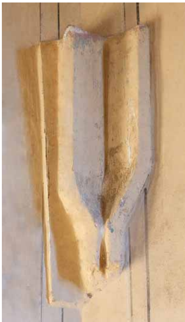
4. Desprinderea bolții din colțul sudic al peretelui răsăritean al corului

Detaliile arhitectonice ale corului alipit navei într-o perioadă mai târzie au fost confecționate în general din piatră. La soclu ne-am referit deja anterior. Cornișa este barocă. Singurul contrafort care s-a păstrat la colțul sud-estic al corului, prezintă