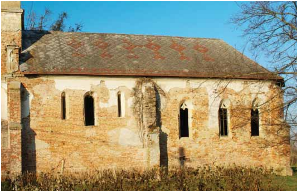
2. Fațada sudică a bisericii