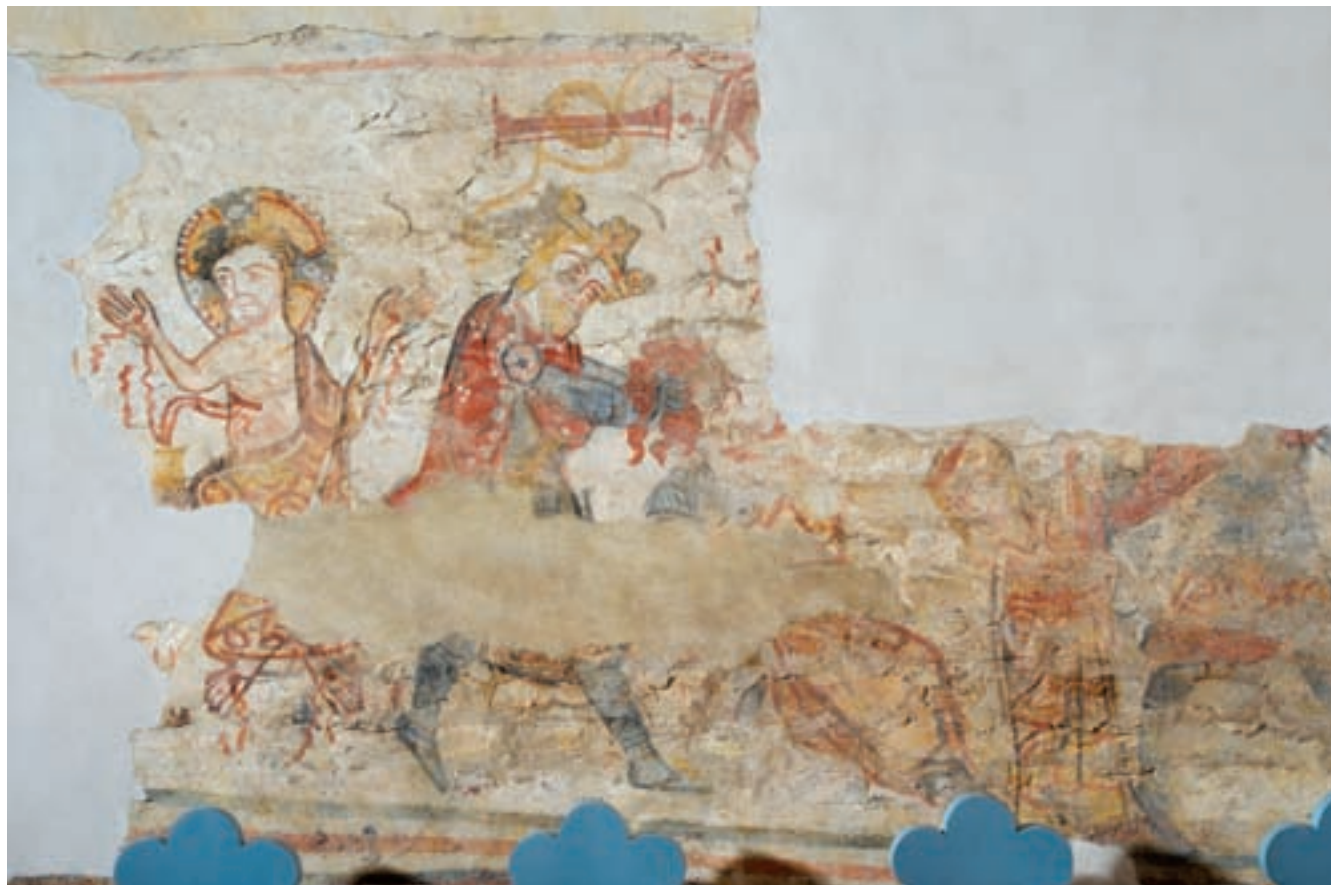
4. Szent László-legenda és Vir dolorum ábrázolás

A kutatás eredményei alapján tehát az első templom egy viszonylag rövid, kis méretű, közel négyzet alaprajzú hajóból és attól erőteljesen beugró diadalívvel elválasztott, keskenyebb félköríves apszisból állt. Az alaprajz legközelebbi rokona a Szatmár megyei Csengersima első temploma; 27 meg kell azonban jegyezni, hogy annak nem ismert diadalíve, és ablakformái is mások. A simai első fázist annak részletformái (ablakai, párkányformái, falfülkéi) alapján a XIII. század közepe tájára lehet keltezni. A laskodi templomhoz ennyi részletforma sem áll a rendelkezésünkre, de az megemlítendő, hogy a szentély kialakítása a simainál tagoltabb volt.