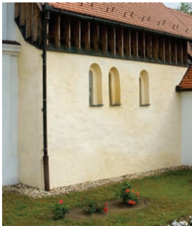
3. Ablakok a déli hajófalán

A kutatás során végzett régészeti feltárás felszínre hozta az eredeti szentélyzáródást. A 4. árok a déli hajófalhoz közel egy íves fal alapozási árkát hozta napvilágra, melynek eredeti anyagára téglatörmelék utalt. Ennek folytatását az 5. és 6. árok is jelezte. Ennek alapján megállapítható volt, hogy a templomot egykor félköríves téglafal határol-