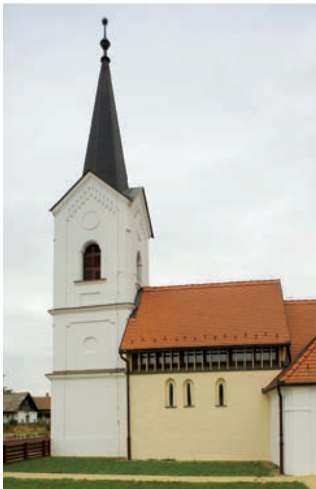
2. A templom délről

A restaurálás során kialakult, mai helyzetet a különböző korú épületrészek diszkrét, de érthető megkülönböztetése jellemzi. A téglából épült, egyhajós templom egyszerű téglalap alaprajzú, melynek déli oldalához előcsarnok, nyugati oldalához háromszintes torony csatlakozik (1–2. kép). Az északkeleti és -nyugati sarkok, valamint az északi homlokzat közepét alacsony támpillérek erősítik. Bejárata a déli előcsarnokon keresztül, illetve a toronyon át, a hajó nyugati falában (a középtengelytől kissé délre eltolva) nyílik. Kétféle ablaknyílás különböztethető meg: a keleti falban egy, az északi és a déli fal keleti részén két-két nagyméretű, téglalap alakú, szegmentíves lezárású ablakot találunk, 21 míg a déli fal nyugati felén egymáshoz közel három kisebb, félköríves záródású, lépcsős béléttű ablak fedezhető fel (3. kép). A hajó nyugati felén (az északi támpillértől nyugatra) a hajófalat egy üvegfalal emelték meg, amelyet fa lamellák tagolnak. Efölött a tetőzet is elválik a keleti hajórésztől. A belsőben ennek felel meg a térlefedés különbsége. Míg a keleti részt kékre festett kazettás síkfödém zárja, addig ennek folytatása a nyugati