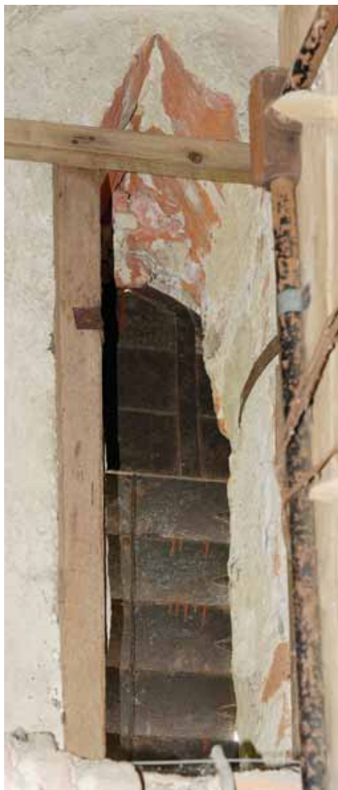
2. A torony első emeleti ablaka

A fényképet Mudrák Attila készítette, az alaprajzot a KÖH őrzi.