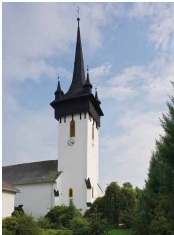
1. A templom tornya északnyugatról

Annak a templommal kapcsolatban felmerült elképzelésnek, amely szerint az épületet Bátori István országbíró, erdélyi vajda a kenyérmezei csata zsákmányából építtette, és az 1486-ban befejezett munkálatokat Mátyás király építtette, „János mester” is megtekintette volna, semmilyen ismert történelmi alapja nincs. 8 Bár Gyarmatot a XV. század végén az ecsedi Bátoriak bírták, a vajda esetleges itteni építkezéséről és a munkálatok időpontjáról írott forrással nem rendelkezünk. 9 A kenyérmezei csata zsákmányának építkezésekhez való felhasználása a nyírbátori Szent György-templommal és az ottani ferences kolostorral kapcsolatban is gyakran felmerül. Ez a csak jóval később, újkori forrásokban feltűnő, s inkább