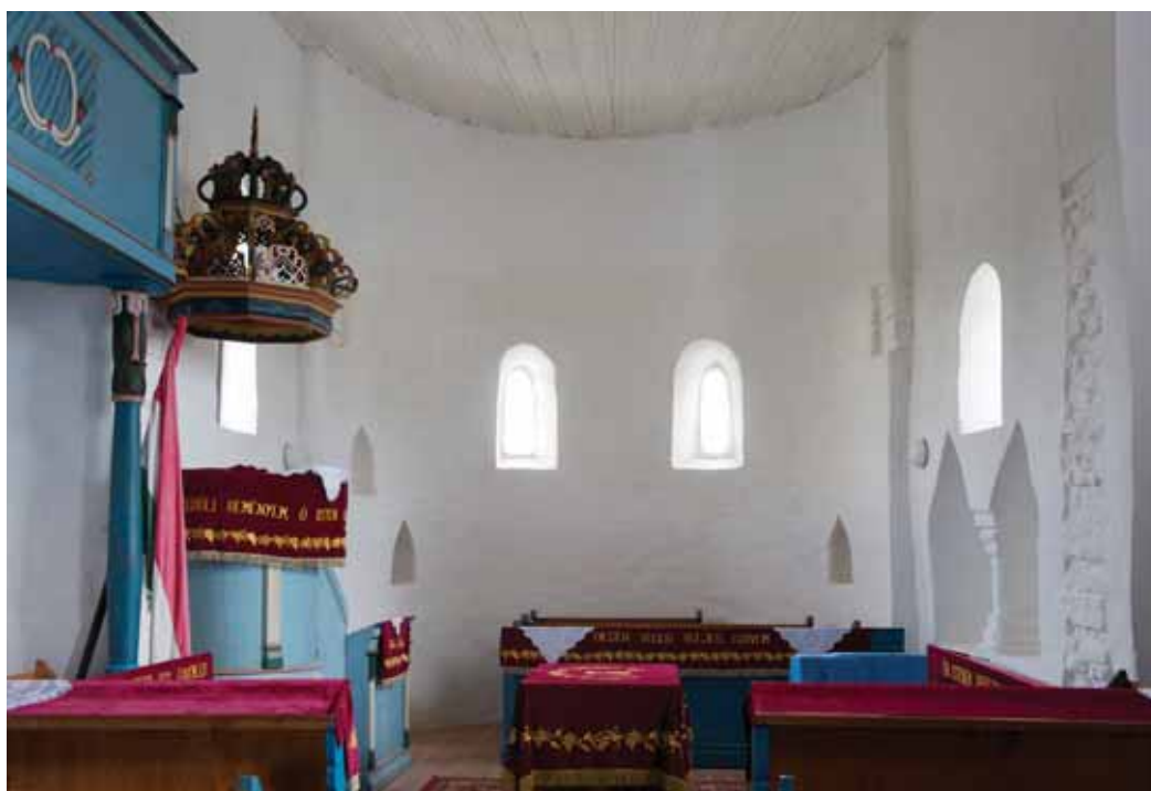
3. A szentély nézete

elbontása, a szentély és a szentélynégyyszög felmagasítása, a déli és északi támpillérek lebontása, 15 az apszis ablakainak és fülkéinek a befalazása. Mindez az 1893 utáni be-