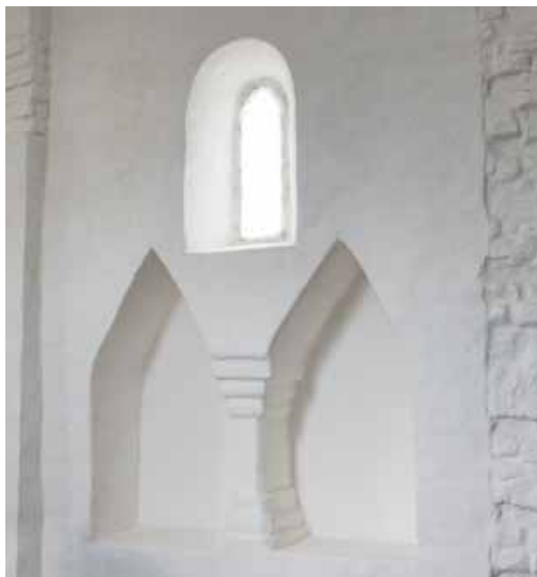
4. Ülőfülke a szentély déli falában

elbontása, a szentély és a szentélynégyyszög felmagasítása, a déli és északi támpillérek lebontása, 15 az apszis ablakainak és fülkéinek a befalazása. Mindez az 1893 utáni be-