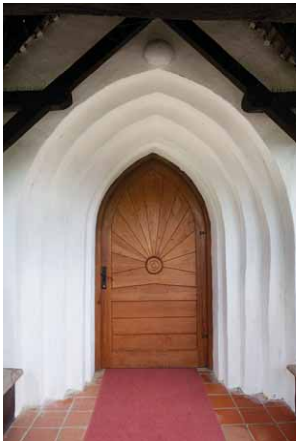
2. A rekonstruált nyugati kapu

A téglalap alakú hajó falazása nagyrészt egységes, és megegyezik a szentélynégyyszög köpenyezésével. Lábazata rézsús, párkánya nem maradt fent; legfelső téglasorai utólagos magasítás során készültek. Délkeleti sarkához az építéssel egykorú, a déli falra merőleges támpillér csatlakozott, 13 melyet utóbb 50 cm-rel magasítottak, majd teljesen elbontottak. Ezzel szemben az északkeleti sarokhoz eredetileg a sekrestye nyugati fala támaszkodott, melynek elbontása után itt merőleges támpillért emeltek; később ezt is visszabontották. Ugyanekkor az északi fal közepén is készült egy támpillér, de ma már ez sincs meg. Megvannak azonban a nyugati fal utólagos (bekötés nélküli), átlós helyzetű támpillérei, melyek lépcsőzöttek. Az északnyugati sarok teljesen újjáépített. Ablakok csak a déli falon találhatók. A nyugati részen egy keskeny, félköríves, rézsús ablak helyezkedik el, meglehetősen ma-