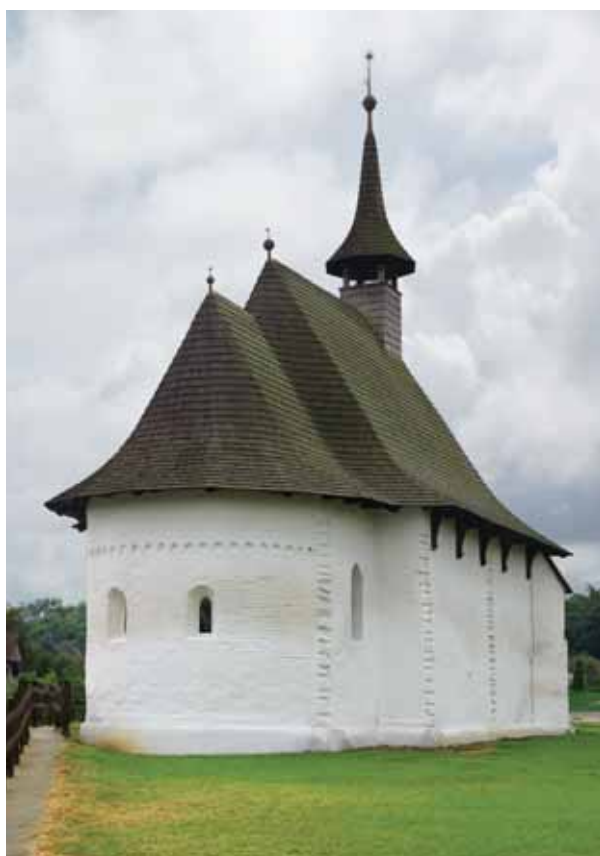
1. Nézet északkeletről